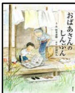
松本春野 作 講談社

みんなが貧しかった時代。少年の活字への渴望に、思いやりで応えたおばあさん。感涙必須作品